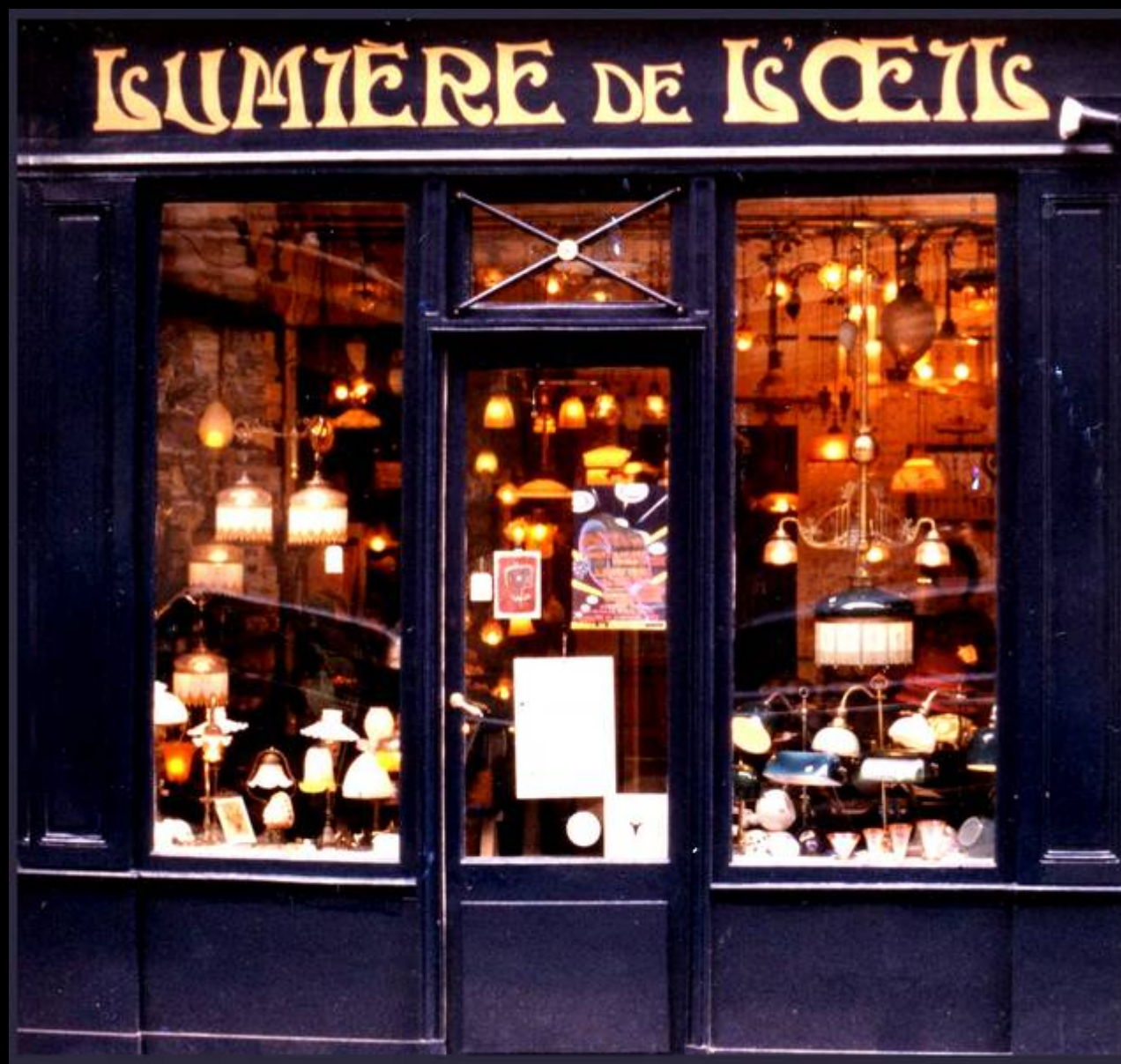
La devanture au 4 rue Flatters dans le 5 e arrondissement de Paris.

Un petit musée des éclairages anciens, une documentation très fournie sur les éclairages non électriques, notamment au gaz et au pétrole, au passé comme au présent et des conseils techniques, historiques et esthétiques dans tous les domaines touchant aux éclairages complètent l'ensemble